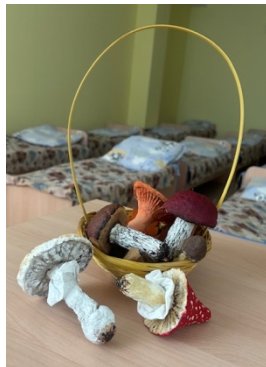
2. Пример демонстрационных материалов из папье-маше