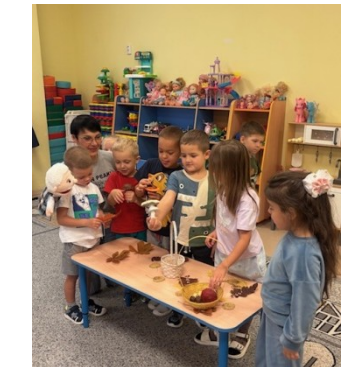
3. Дидактическая игра «Съедобные-несъедобные»

Рассмотрим, как учитываются особенности детей с признаками СДВГ на примере беседы «Хлеб - всему голова» (осенний блок).